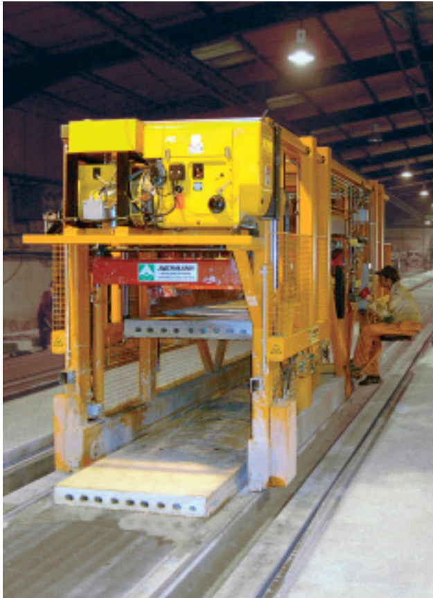
Abheben von Hohllochdecken

Abhebeegeräte für Deckenplatten, Doppelwände oder auch in Kombination werden kranegebunden eingesetzt.