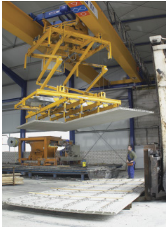
Abheben von Deckenplatten