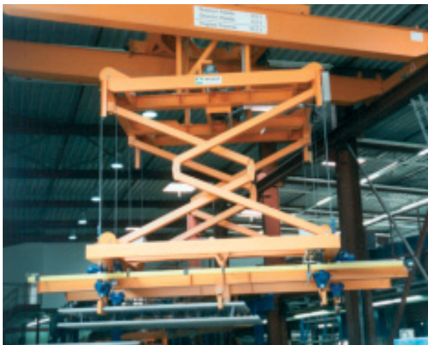
Waagrecht abheben von Doppelwänden