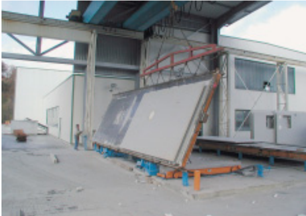
Kippstation mit angeschlagenem Betonelement

Aufrichten von Wandelementen in Palettenumlaufanlagen mit der AVERMANN – Kippstation zum vertikalen Transport der Betonteile.