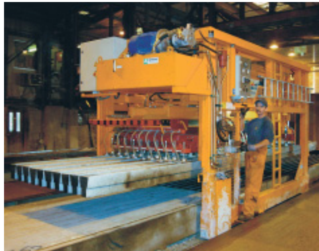
Abheben von Deckenträgern