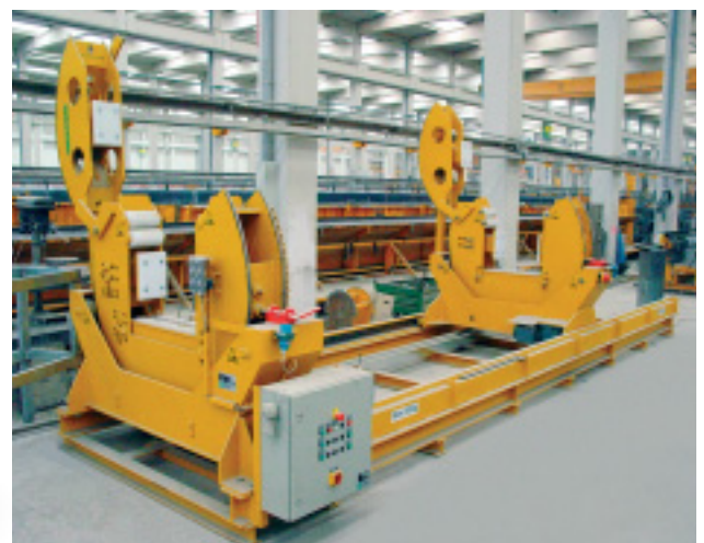
Stützendrehvorrichtung für die Nachbearbeitung von Stützen, wie z.B. Befestigung von Konsolen