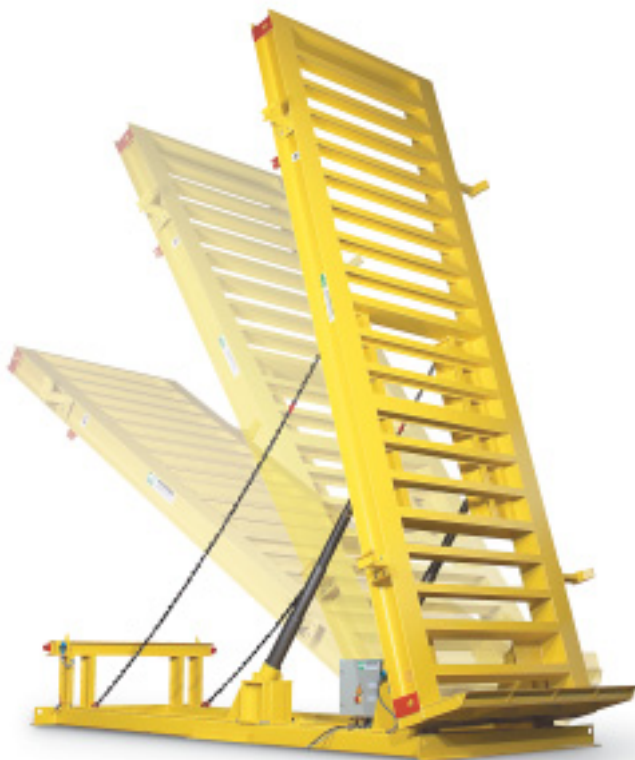
Transportable Aufrichtstation für Doppelwände