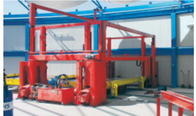
Stapel- und Entstapelstation für Umlaufpaletten