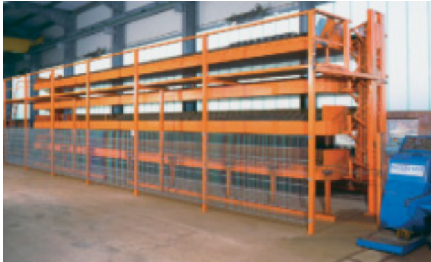
AVERMANN Gitterträgerpaternoster zur platzsparenden Lagerung von Gitterträgerpaketen

AVERMANN - Sondermaschinen werden individuell nach Ihren Wünschen entwickelt und gefertigt. Dabei steht Ihnen unser Expertenteam für die vielfältigsten Aufgabenstellungen zur Verfügung.