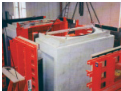
Betonfertigteil wird entschalt