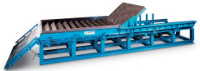
Verstellbare Treppenschalung für „Negativ“-Fertigung