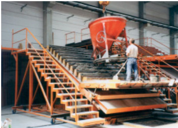
Produktion der Treppe