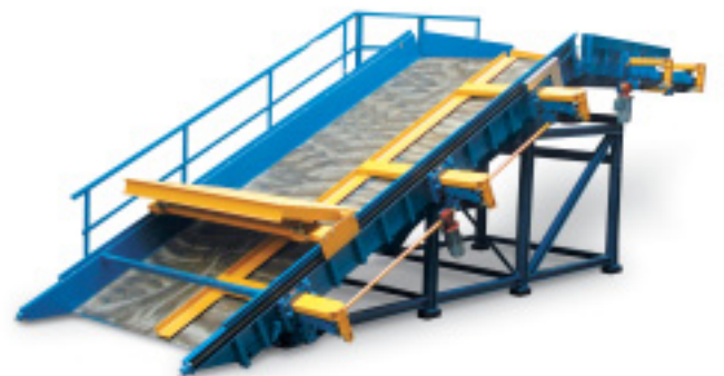
Treppenschalung mit Ober- und Unterpodest, in der Breite verstellbar