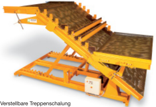
Verstellbare Treppenschalung mit Ober- und Unterpodest

Die geradläufige verstellbare Podesttreppenschalung ist die flexible Lösung für alle Treppen bis 3 m Breite, max. 18 Stufen und alle Steigungen zwischen 25 und 45 Grad.