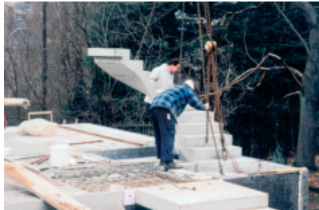
Montage der Treppe