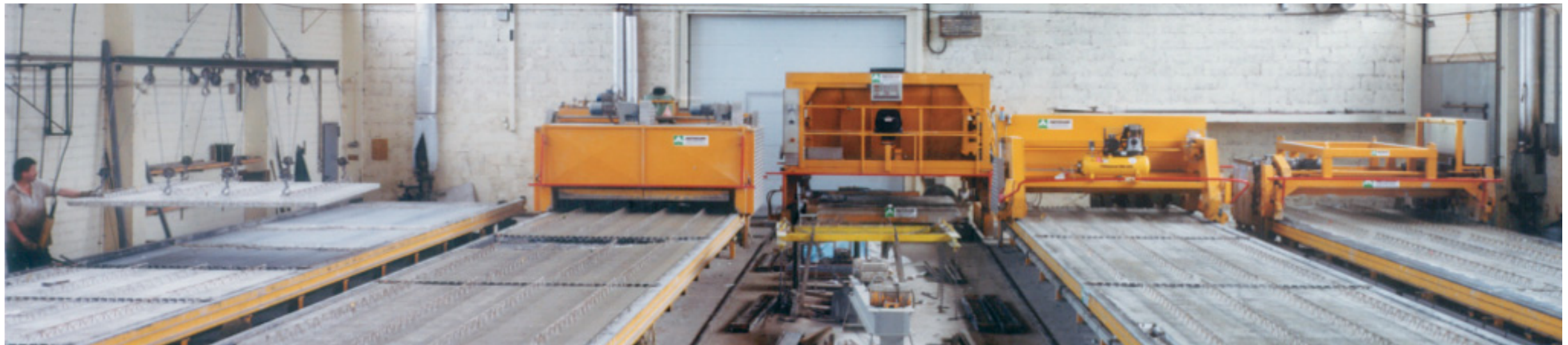
Gesamtübersicht der Bahnenfertigung