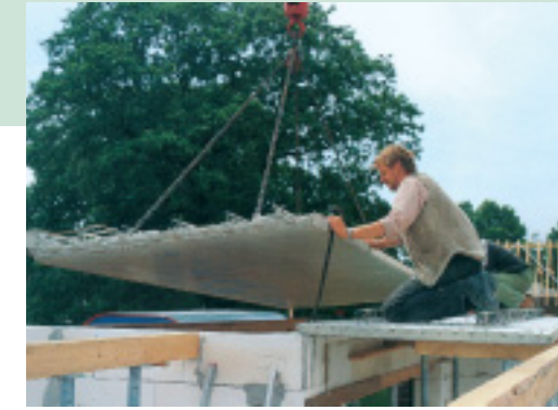
Montage der Elementdecke

Als Alternative zur computergesteuerten „High-tech“ Umlaufanlage spielt die Bahnenfertigung eine nicht unbedeutende Rolle. Hier wird im Zusammenspiel von stationären Fertigungsbahnen und beweglicher Maschinenteknik ein Automatisierungsgrad erreicht, der für eine bestimmte Produktionskapazität eine hohe Wirtschaftlichkeit erzielt. Dabei ist es nach Festlegung der Fertigungsbreite möglich, Elementdecken sowie auch Doppelwände effektiv zu produzieren.