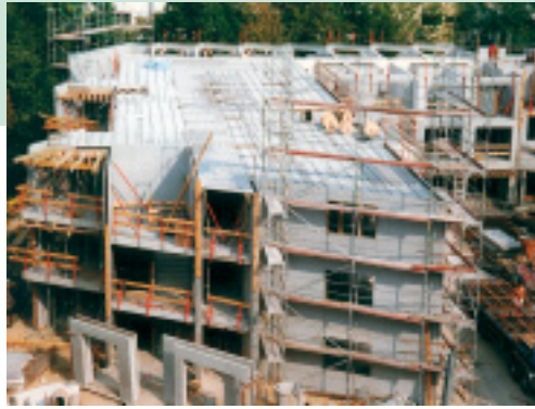
Montage der Elementdecken und Doppelwände

Als Alternative zur computergesteuerten „High-tech“ Umlaufanlage spielt die Bahnenfertigung eine nicht unbedeutende Rolle. Hier wird im Zusammenspiel von stationären Fertigungsbahnen und beweglicher Maschinenteknik ein Automatisierungsgrad erreicht, der für eine bestimmte Produktionskapazität eine hohe Wirtschaftlichkeit erzielt. Dabei ist es nach Festlegung der Fertigungsbreite möglich, Elementdecken sowie auch Doppelwände effektiv zu produzieren.