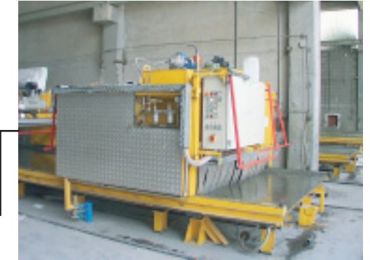
Reinigungs- und Einsprühmaschine