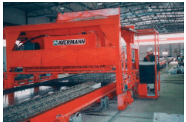
Betonverteiler in Vollportalausführung