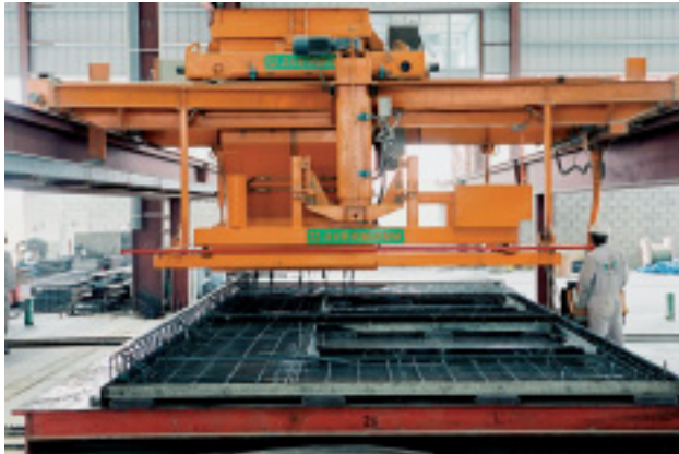
Betonverteiler in Brückenausführung mit Kübelquerfahrt