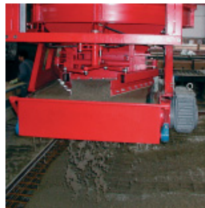
Detail Bandaustrag mit Austragsbreitenverstellung