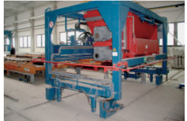
Betonverteiler in Vollportalausführung mit Querfahrwerk