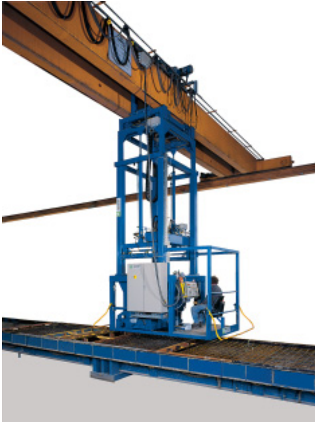
Kranangekoppelter Betonverteiler mit Fahrerstand

Betonieren im gesamten Hallenbereich durch halbautomatische Ankoppelung an einem 2-Träger-Brückenkran, der nach dem Betoniervorgang wieder als Hallenkran nutzbar wird. (Flexibel)