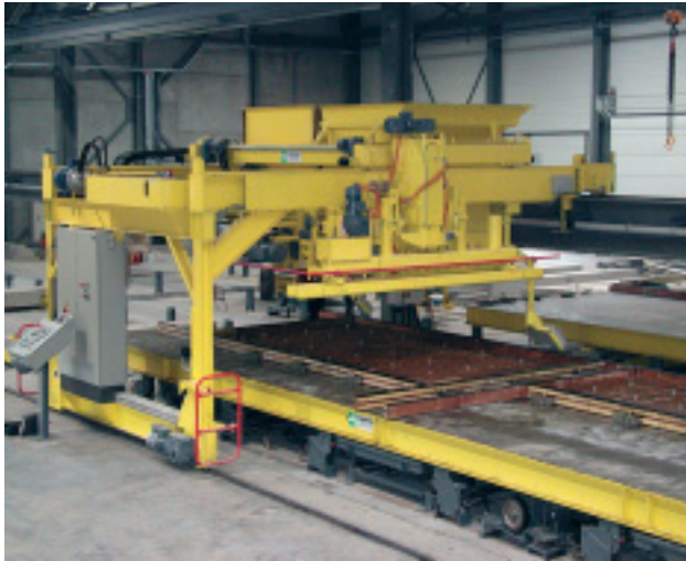
Betonverteiler in Halbportalausführung mit zwei separaten Kübeln

Variabel verarbeitet er Betonqualitäten, ob in manueller oder automatischer Bedienung.