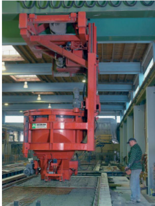
Kranangekoppelter Betonverteiler mit Funkfernbedienung

Flexibles Betonieren mittels Bandaustrag in einer Brückenträgerkonstruktion.