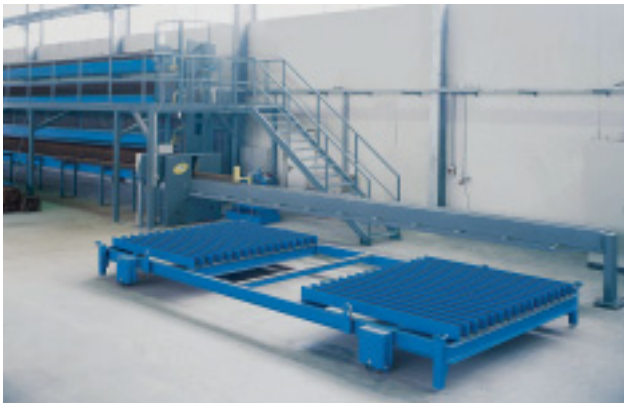
Gitterträgerschneidanlage und Lagersysteme