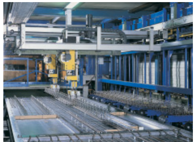
Automatische Bewehrungssysteme mit Stahlverlegeroboter für Längs- Querstäbe und Gitterträger (für Elementdecken, Doppelwand und Massivwand)