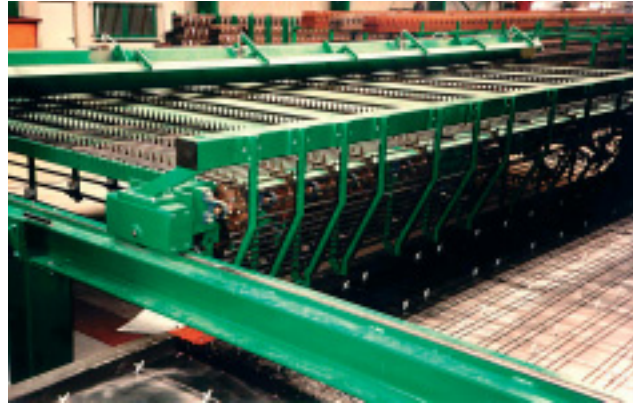
Verlegesysteme für Längs- oder Querstäbe (für Elementdecken)