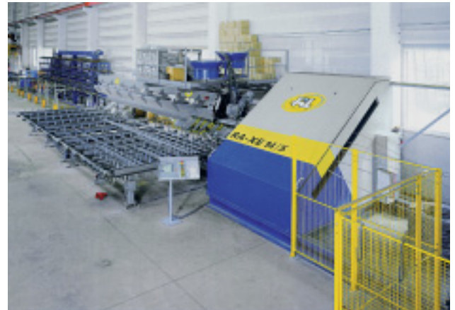
Rotorricht- und Schneidemaschinen für Betonstahl vom Coil ( \varnothing 6mm bis \varnothing 16mm), mit schnellem Drahtdurchmesserwechsel