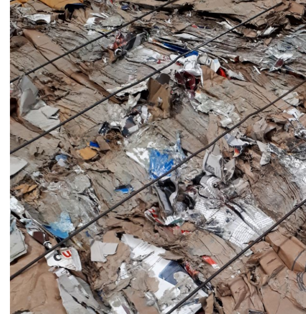
Schnittfläche mit OptiCut bei Ballenmaterial 1.04